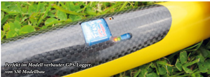
Perfekt im Modell verbauter GPS-Logger von SM Modellbau

modelle im DMFV verfolgte interessiert die Vorträge und bereicherte die anschließende Diskussion mit seinem Fachwissen. Der Teilnehmerkreis war bunt gemischt. Vom relativ unerfahrenen Modellsegelflieger über Sportfreunde, die eine jahrzehntelange Modellflug-Erfahrung mitbringen, bis hin zu den OLC-Cracks, die mit lässiger Sicherheit stets das Maximum aus dem Wetter rausholen und in den täglichen Rankings immer ganz vorne zu finden sind, war alles dabei.